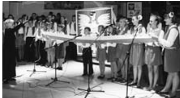
Zespół «Grodzińskie Słowiki»

Grodzińskie Słowiki . Dziecięcy zespół od 1990 r. działa przy Klubie Polskich Tradycji Narodowych w Grodnie. W repertuarze ma pieśni o tematyce patriotycznej, religijnej oraz utwory muzyki klasycznej. Zespół ma na swoim koncie wiele koncertów przed publicznością Polski, Niemiec, Wielkiej Brytanii i Białorusi.