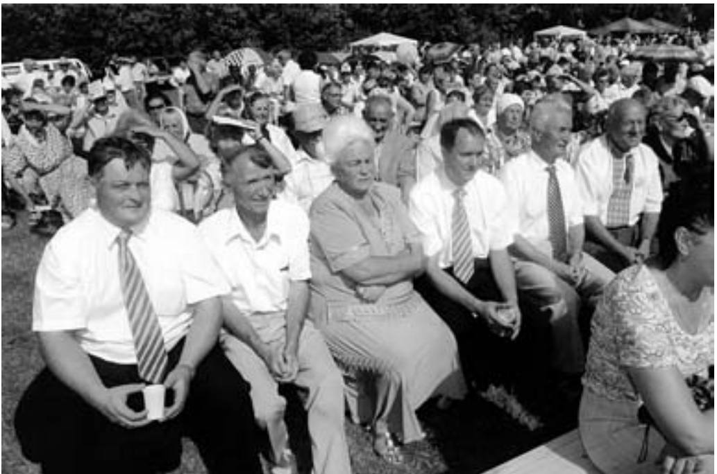
Przedstawiciele władz miejscowych podczas uroczystości

Tak nazywają się kobiety z towarzystw gospodyń wiejskich z Mimonia i Beska, które specjalnie na święto z pszenicznych i