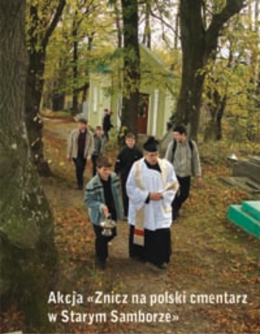
Akcja «Znicz na polski cmentarz w Starym Samborze»