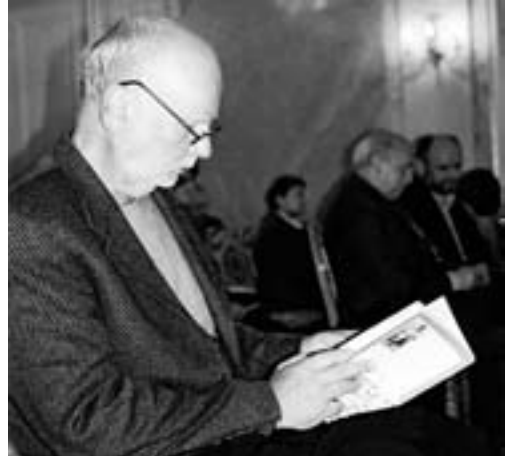
A. Zagajewski zapoznaje się z poezją lwowian

W ramach Forum odbywały się spotkania z pisarzami, poetami z różnych krajów. Późnym wieczorem w Wieży Prochowej – aktualnie Klub Architektów – spotkali się ci, kogo porusza hasło Zbigniew Herbert . Bowiem tu dzielili się swoimi refleksjami o Herbercie poeci Ryszard Krynicki i Adam Zagajewski. R. Krynicki zaznaczył, że Herbert był jego osobistym przyjacielem i miał niewątpliwie ogromny wpływ na jego życie. Był to poeta szczególny, wielki, obecnie nastał czas, by jego utwory doczekały się nowego odczytania. Nie należy zapominać o eseistyce Z. Herberta. Nie wszystkie eseje ukazały się w druku, pozostały jeszcze bruliony, które należy odczytać – to praca dla przyszłych pokoleń.