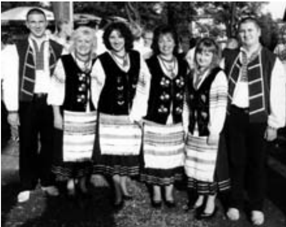
Folklorystyczny zespół „Już melem”

żytnich kłosów plotą Korowody , ozdabiają wstążeczkami i kwiatami, układając przy tym pieśni o życiu obu wiosek, o tegorocznym urodzaju, o osiągnięciach i niedociągnięciach w pracy gminy. Te wesołe i dowcipne przyspiewki były nagradzane rzęsiстыми brawami. Entuzjazm wzbudziła również orkiestra dęta wsi Besko, która z zapalem wykonywała melodie ludowe, utwory klasyczne oraz urywki z popularnych seriali telewizyjnych.