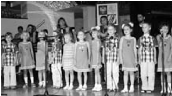
«Wesoła Gromadka» podczas występu

Pięknie ubrane dzieci – to Wesoła Gromadka , lubiana nie tylko na Grodzieńszczyźnie, ale także na ziemi mrągowskiej, wykonała piosenki.