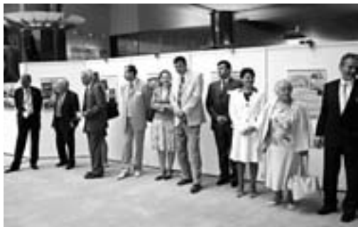
Bruksela. Otwarcie wystawy fotograficznej poświęconej XX-leciu ZPB